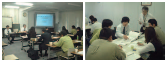
若手社員への品質／環境マネジメントシステム研修